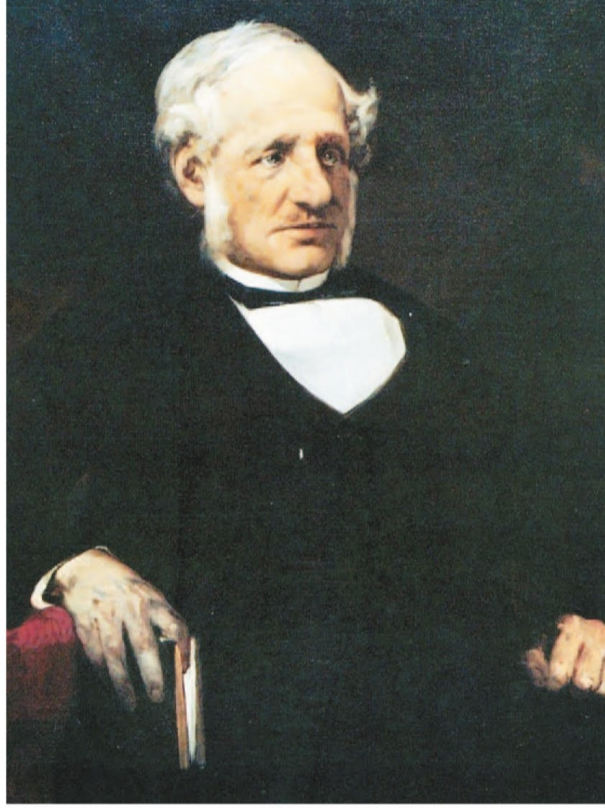
Aleksandros Rizos Rangavis (1809-1892) İstanbul, Arnavutköy'de doğdu. Ailesiyle Bükreş'e yaşamaya gittiğinde dört yaşındaydı.

Mukavelat Muharriri, o devirde Yunan edebiyatından çevrilip Türkçe yayımlanmış az sayıdaki romandan biridir. Konusu Kefalonya Adası'nın Argostoli şehrinde noter (mukavelat muharriri) olan Tapas ve etrafındaki kişilerle ilgili entrika, cinayet ve aşk içeren, nihayet mutlu son ve adaletin yerini bulmasıyla biten bir öyküdür. Yunanistan'da ilk olarak 1853'te Pandora adlı edebiyat ve kültür dergisinde yayımlanan Mukavelat Muharriri, yirminci yüzyılın ikinci yarısından sonra yaptığı yeni baskılarla tarihsel ve toplumsal açıdan taşıdığı önemden dolayı yazarı Aleksandros Rizos Rangavis'in on dokuzuncu yüzyılda yazdığı roman ve öyküler arasında en büyük ilgiyi gören ve yeniden canlanan bir romanı olmuştur. Nitekim Yunan televizyonu 1979-1980'de Mukavelat Muharriri'ni